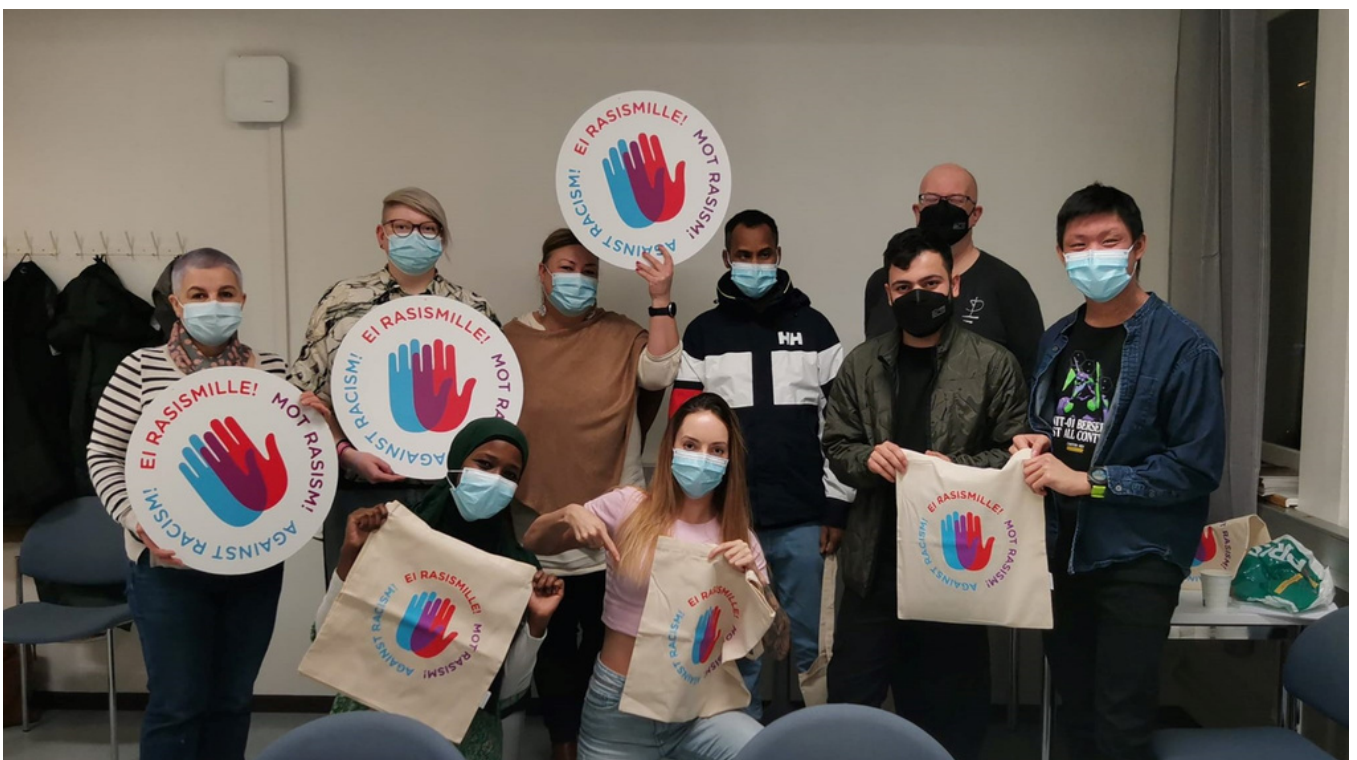
Satakunnan avainhenkilöiden perehdytyksessä sanoimme Ei rasismille!

Hankkeen työntekijät kävivät myös tutustumassa järjestökumppanin Satakunnan Monikulttuuriyhdistyksen tiloissa Satakunnan yhteisökeskuksessa.