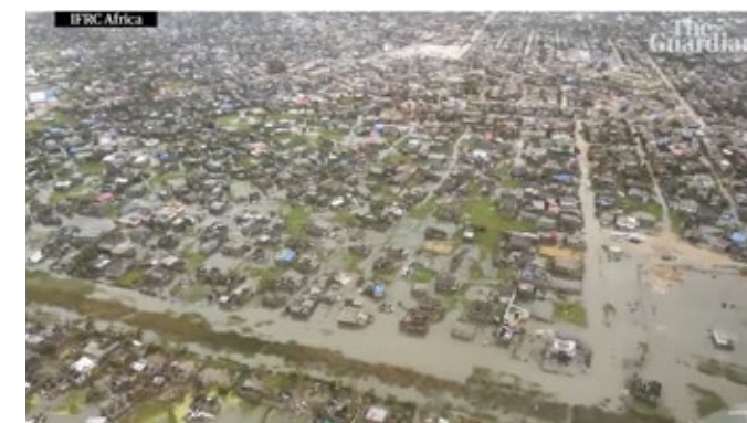
Aerial footage shows Cyclone Idai devastation in Mozambique Aerial footage shows the scale of damage to Beira in Mozambique following Cyclone Idai. Up to 90% of the port city has been damaged or destroyed, according to the Red Cross. More than 100,000 people have been displaced and thousands have been killed.