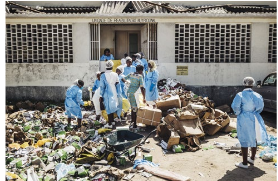
Cyklonen Idai förstörde stora delar av Beiras sjukhus.