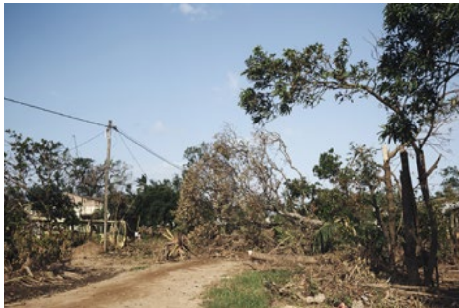
Beira, Mosambik, hirmumyrskyn jälkeen.

vitimme muita mahdollisuuksia päästä alueelle mahdollisimman pian. Päädyimme ottamaan auton, vaikka matka kestäisi vähintään 16 tuntia. Kymmenen tuntia ajettuumme saimme tiedon, että kaikki Beiran kaupunkiin johtavat tiet olivat poikki tulvien johdosta. Mitä nyt tekisimme?