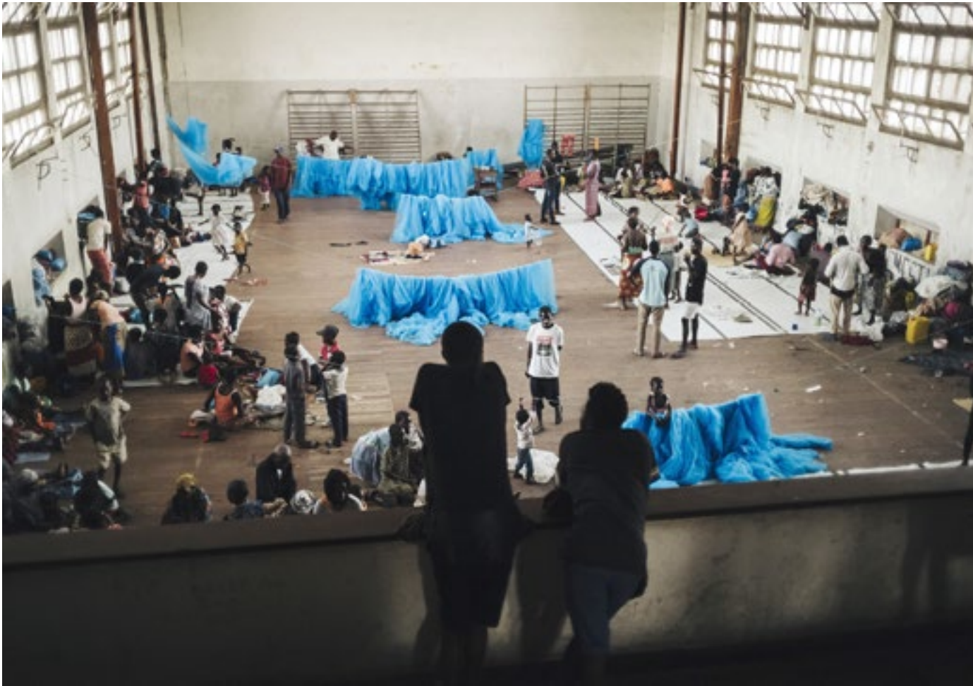
Beirassa Escola Secundaria Samoran kouluun on hätämajoitettu 1321 ihmistä. Suurin osa ihmisistä on Buzista ja 175 Beirasta. Buzin alue oli yksi pahiten vaurioituneista alueista.