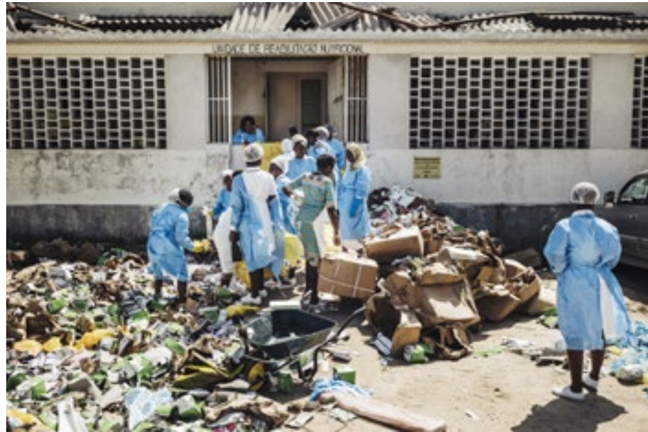
Hirmumyrsky Idai tuhosi pahasti Beiran sairaalan