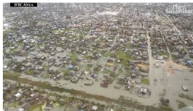
Small footage shows the extent of damage to Beira in Mozambique following Cyclone Idai. 90% of the city's houses destroyed in destroyed according to the Red Cross. The UN says that about 100,000 people are still in IDP camps and some are in IDP camps.

ehtoiset ovat paikalla yhteisöissä ennen katastrofia, sen aikana ja vuosikausia sen jälkeen.