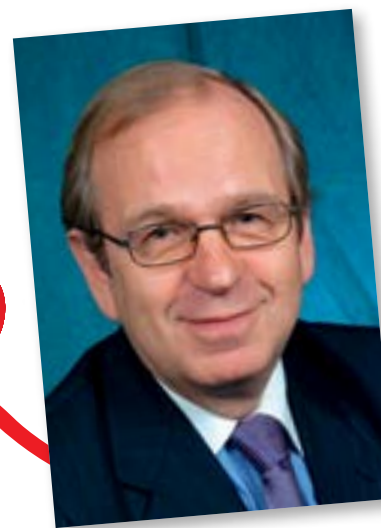
Erkki Liikanen puheenjohtaja Suomen Punainen Risti